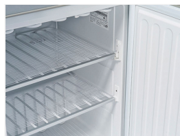
Ripiani evaporatore fissi