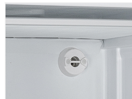
Valvola di pressione per fácilitare l'apertura porta