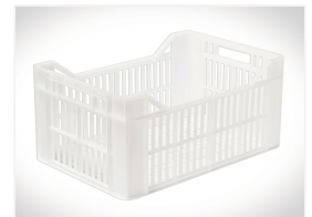
Adatto per contenere fino a 12 ceste (Dim: 440x290x200 mm)