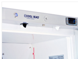
Allarme apertura porta / Allarme alta temperatura