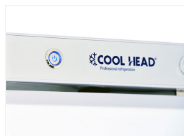
Interruttore retroilluminato (Colore Blu)